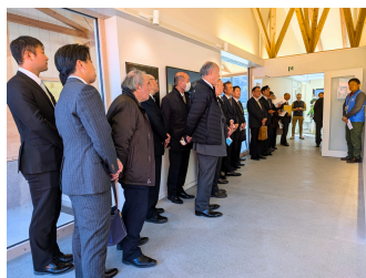
長野県神社庁紅葉会視察