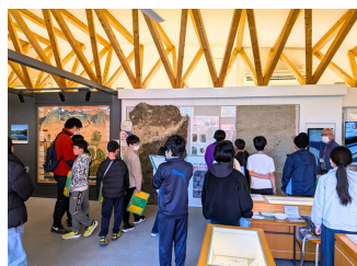
福島小学校6年生 理科授業 「大地のつくりと変化」